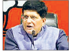
केंद्रीय मंत्री पीयूष गोयल

केंद्र भारत-अमेरिका ट्रेड डील को भारत की बड़ी जीत के तौर पर सामने रख रहा है