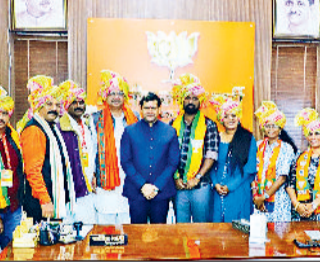
निगम कमिश्नर ने एक प्रजेंटेशन के जरिए यहां का इन्फ्रास्ट्रक्चर दिखाया और समझाया कि किस तरह नायब सरकार विकसित हरियाणा के संकल्प को धरातल पर उतार रही है।

गुरुग्राम। प्रधानमंत्री के विकसित केरलम के सपने को साकार करने के लिए केरल में निकाय चुनाव जीतने वाले बीजेपी के मेयरों व पंचायत सदस्यों का एक प्रतिनिधिमंडल शनिवार को गुरुग्राम पहुंचा और साइबर सिटी के विकास को गाथा को समझा। आठ सदस्यीय इस स्टडी ग्रुप ने गुरुग्राम में चल रहे विभिन्न प्रोजेक्ट्स को देखा और समझा। गुरुग्राम में भाजपा नेताओं, निगम अधिकारियों और पार्षदों से बैठक की, जिसमें दोनों प्रदेशों में निगमों व पंचायतों के इन्फ्रास्ट्रक्चर पर चर्चा हुई। गुरुग्राम की मेयर व