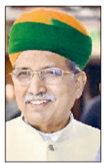
हरियाणा ने चंडीगढ़ में अलग हाईकोर्ट का प्रस्ताव भेजा

चंडीगढ़। विधि एवं न्याय मंत्रालय में राज्य मंत्री (स्वतंत्र प्रभार) तथा संसदीय कार्य मंत्रालय में राज्य मंत्री अर्जुन राम मेघवाल ने संसद में पूछे गए एक प्रश्न के उत्तर में स्पष्ट किया है कि हरियाणा के लिए अलग उच्च न्यायालय स्थापित करने का कोई प्रस्ताव इस समय केंद्र सरकार के पास लंबित नहीं है। उन्होंने बताया कि सांसद वरुण चौधरी द्वारा पूछे गए प्रश्न के उत्तर में यह जानकारी दी गई। हरियाणा सरकार ने चंडीगढ़ में राज्य के लिए पृथक उच्च न्यायालय की स्थापना का अनुरोध किया था। इस संबंध में केंद्र सरकार ने पंजाब एवं हरियाणा उच्च न्यायालय और पंजाब सरकार से उनके विचार मांगे थे। मंत्री ने बताया कि पंजाब सरकार ने इस प्रस्ताव से असहमति जताई थी। वहीं, पंजाब एवं हरियाणा उच्च न्यायालय ने अपनी पूर्ण पीठ की बैठक में इस विषय पर कोई मत व्यक्त नहीं किया।