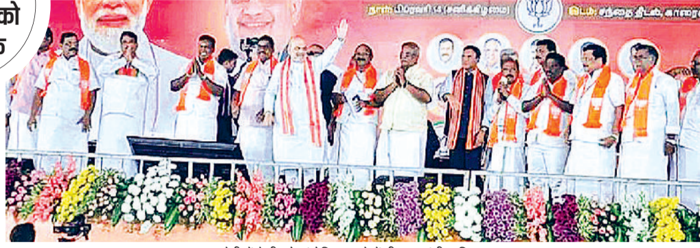
पुडुचेरी में रैली को संबोधित करते केंद्रीय गृहमंत्री अमित शाह

लोकसभा में नेता विपक्ष राहुल गांधी की तरफ से हालिया भारत-अमेरिका व्यापार समझौते और केंद्र की नीतियों पर दिए बयान के बाद सियासत गरमा गई है।