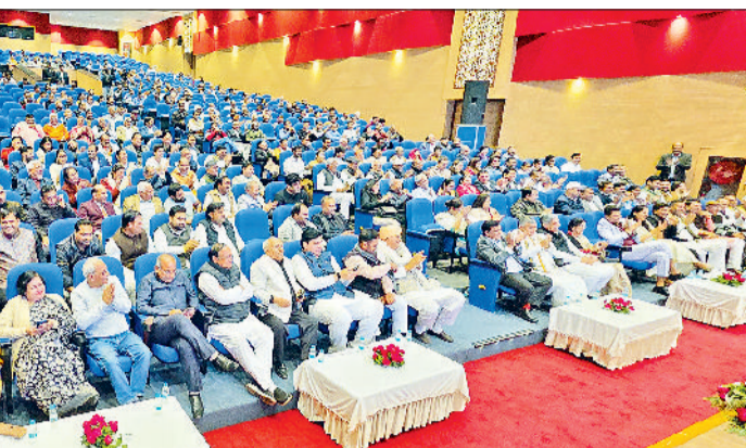
सोनीपत। कवियों की रचनाओं का शहरवासियों ने जमकर लुफ उठाया, तालियों से किया उत्साहवर्धन।

इस साहित्यिक उत्सव के सफल आयोजन में जीवीएम शिक्षण संस्था, दीवान चैरिटेबल ट्रस्ट, हरी मदान मोटर्स, कर्मा पेशोलाजी लैबोरेट्री, जीडी गोंयका इंटरनेशनल स्कूल सोनीपत, शिवा शिक्षा सदन विद्यालय, गौन वैली इंस्टीट्यूट ऑफ स्पेशल एजुकेशन एंड री. सेंटर, कनकत गुप, बहालगाढ़ स्टील उद्योग, टैडिंग गुरुकुल - ए स्टॉक मार्केट इंस्टीट्यूट, डेवाइज सिटी, अंडीमेडा कैंसर हॉस्पिटल, मामा यादव शिवा दाबा, पीएनबी किचनमेट, जैन विद्या मंदिर वरिष्ठ माध्यमिक विद्यालय, सरस्वती शिक्षा संस्थान वरिष्ठ माध्यमिक विद्यालय, बाल भवन इंटरनेशनल स्कूल, ज्ञान गंगा वलौबल स्कूल एवं अपोलो इंटरनेशनल स्कूल और मीडिया पार्टनर जनता टीवी का विशेष सहयोग रहा।